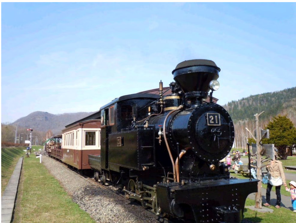
丸瀬布：いこいの森「雨宮21号」